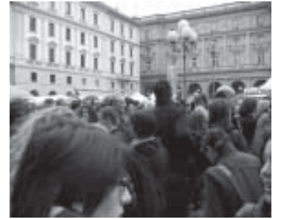
Policoro che si alzano alle 3-4 di mattina e ritornano nel buio della sera tardi. Dedichiamo l'8 marzo anche all'altra donna.

La festa della donna: forse anche qui, si fa un po' di retorica, come per il 150° dell'Unità d'Italia. Meno male che il presidente della Repubblica Giorgio Napolitano abbia messo un punto: "La donna rischia di passare da soggetto a oggetto; l'8 marzo non è una festa consumistica". L'altro giorno, sulle montagne del mio paese tirava un forte nevischio; una giovane vedova, con il freddo intenso di questi giorni, incappucciata con un vecchio cappotto da uomo, e con una sciarpa logora, appoggiata a un bastone, pascolava le pecore. Le raccogliatrici di Sibari e di