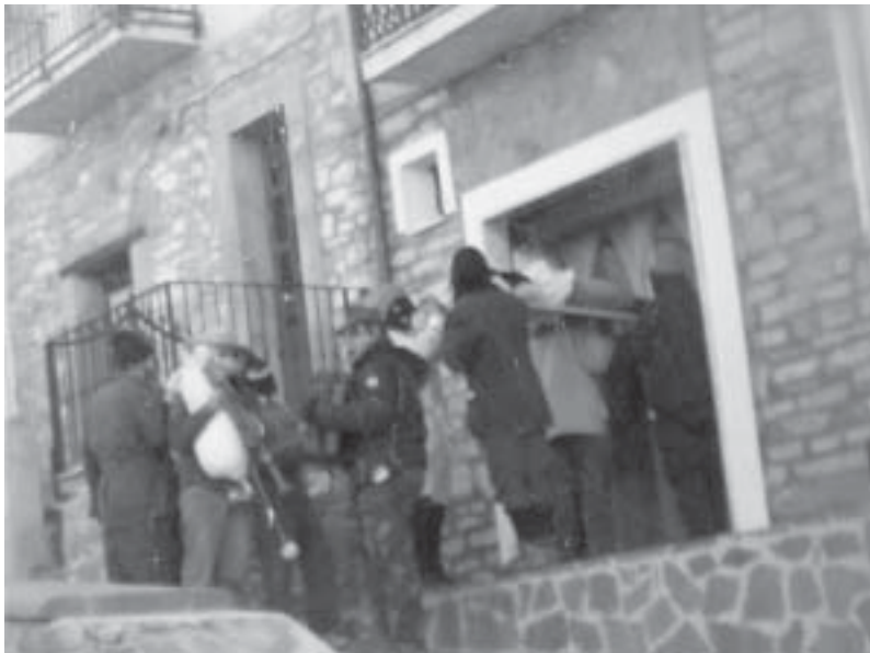
Albidona, Carnevale 2011

Quando rivedo Albidona , il compare che mi invita all'annuale festa del porco mi porta per tutta la strada di circonvallazione e dice che "dopo il castello, c'è pure la torre di guardia". Mi informa anche della tregua e della