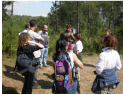
Lezione sulla territorialità degli Strigiformi