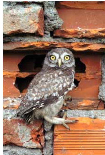
Esemplare di Athene noctua

proprio a particolarità ambientali che devono puntualmente essere descritte.