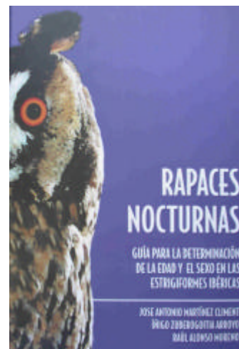
Martinez Climent J.A., Arroyo Zuberogoitia I., Moreno R.A., 2002. Rapaces nocturnas— Guía para la-determinacion de la edad y el sexo en las Estrigiformes ibéricas. Monticola Edt. Pp.144

Si tratta di un volume davvero unico nel panorama editoriale mondiale e dotato di un'iconografia davvero ricchissima.