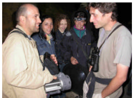
Lezione notturna