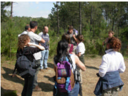
Lezione in pineta